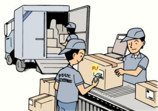
出荷前の読取りチェック