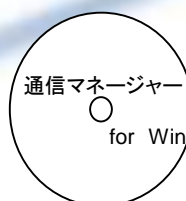
通信マネージャー for Win (Windows7、8.1対応)

※最低構成は、PM200のみでバーコードや2次元コード読取確認、照合が可能です。 ※読取結果や照合結果 (CSVファイル) をパソコンへ送信する場合は、クレードルと通信マネージャーが必要になります。 ※コピー発行、照合結果発行時は、DaVinci-Lが必要になります。