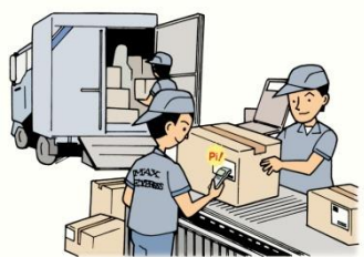
出荷前の読取りチェック