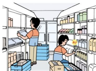
倉庫での出荷検品 (照合)